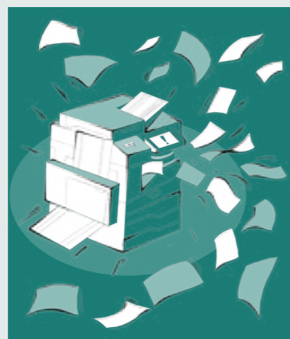
↑ Illustration de Corin Ommerli , 2 e année de formation en classe de graphisme, F+F École d'art et de design de Zurich

Pour illustrer ceci, citons des projets comme « Allume ton feu », réalisation d'une machine permettant de fabriquer des allume-feux à partir de copeaux issus de la coupe de bois conçue par des forestiers/ières bûcheron-ne-s, des électronicien-ne-s, des automaticien-ne-s et des constructeurs/trices métalliques, ou encore le « quadraclette », un