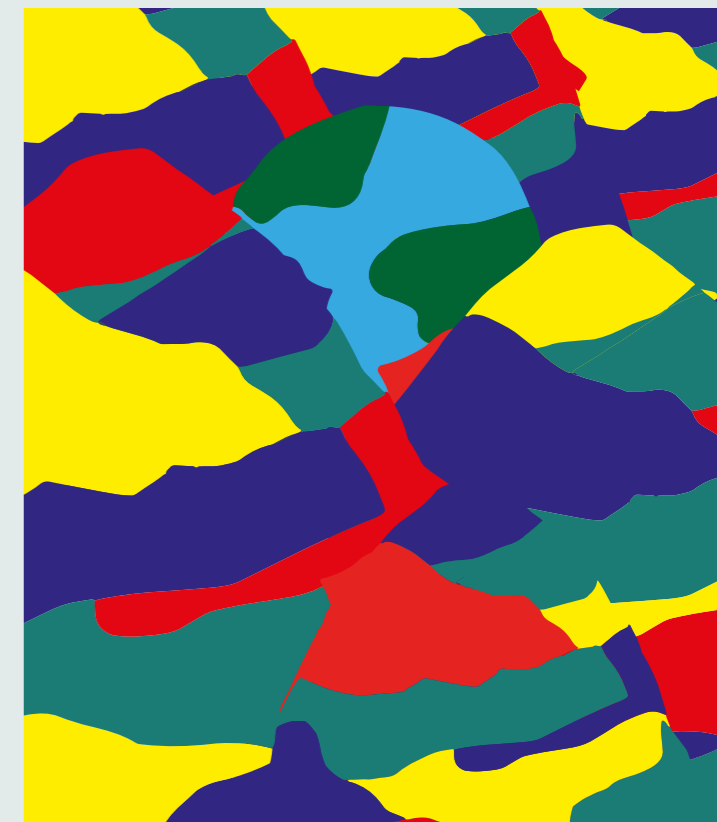
↑ Illustration de Daniela Dellanoce , 2 e année de formation en classe de graphisme, F+F École d'art et de design de Zurich

Le monde d'aujourd'hui pose à l'humanité des défis importants : problèmes environnementaux, inégalités, pandémies, etc. Face à ces constats préoccupants, l'école ne peut pas rester inactive et les questions récurrentes qui agitent le monde de l'éducation doivent encore une fois être posées : que faut-il enseigner à l'école ? Comment préparer au mieux les nouvelles générations au monde