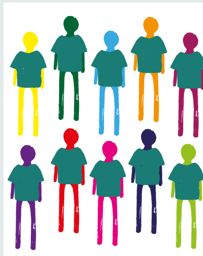
↑ Illustration de Daniela Dellanoce , 2 e année de formation en classe de graphisme, F+F École d'art et de design de Zurich

four à raclette écologique créé par des cuisiniers/ères, des mécanicien-ne-s et des logisticien-ne-s.